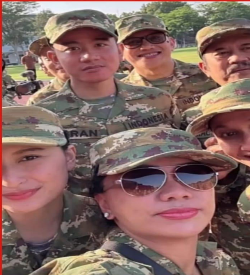
Manfaat Jangka Panjang dari Pembekalan Kabinet di Akmil Magelang